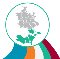
NYKØBING F. KLYNGEN