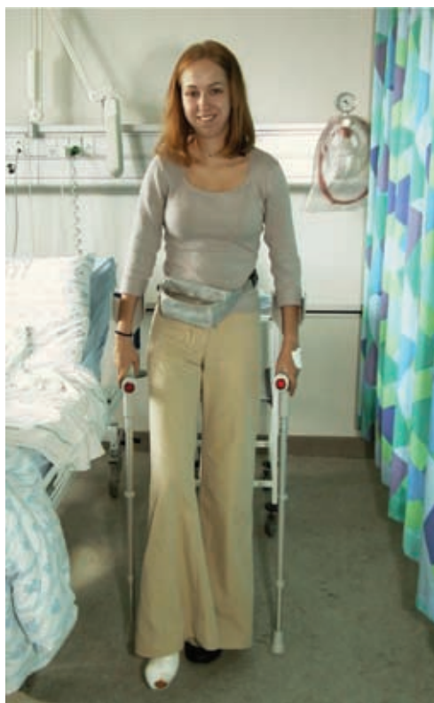
Figur 5. Patienten på vej hjem

Dette er nødvendigt, da det ellers ville være meget smertefuldt for patienten, fordi blokadens virkning ikke omfatter dette område. Hvis patienten vælger generel anæstesi, anlægges blok på operationsstuen efter indledning af anæstesi. Hvis patienten vælger spinal anæstesi, lægges blok først efter afsluttet indgreb i opvågningsstuen.