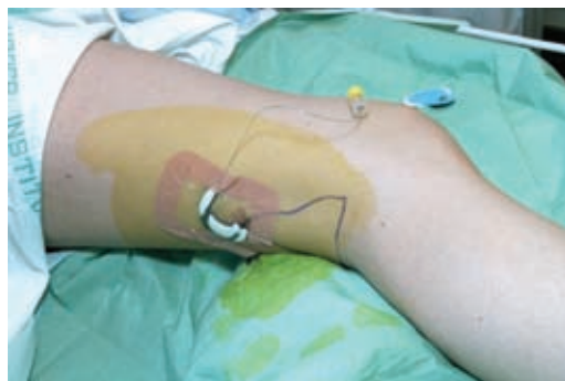
Figur 3. Kateter er lagt og fikseret til huden

Praktisk gennemførelse: Efter at der, som beskrevet, er anlagt blokade af n. ischiadicus i knæhasen, indføres et kateter 3-5 cm gennem kanylen (Fig. 3). Derefter tilkobles en elastomerisk pumpe (med et volumen på 275 ml og infusionshastighed på 5 ml/t) fyldt med Naropin 2 mg/ml, hvorved blokadens virkning forlænges (blok + pumpe metoden – Fig. 4). I vore studier har vi anvendt engangspumper (elastomerisk infusor LV5, Baxter). Infusionssystemet er ikke elektrisk eller gravitationsafhængigt, men er udelukkende et elastomerisk overtrykssystem. Pumpen har et ballonreservoir fremstillet af en enkel elastomerisk membran til at skabe infusionstryk som drivkraft. Når reservoiret fyldes etableres et overtryk, som er stabilt fra start til slut. Infusionshastigheden bestemmes af en flowregulator med et kapillærrør, som vender mod patienten. Pumpen er enkel og nem at bruge for både personale og patient, fordi man ikke behøver at justere hastigheden. Den er let og kan bæres i en bæltetaske omkring livet, således at den ikke interfererer med patientens aktiviteter.