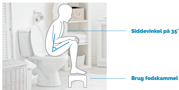
Korrekt siddestilling på toilettet

Hvis du har en fornemmelse af, at du ikke har fået tømt blæren helt, efter du har været på toilettet, er det en god idé at sætte sig igen og se, om der kommer mere.