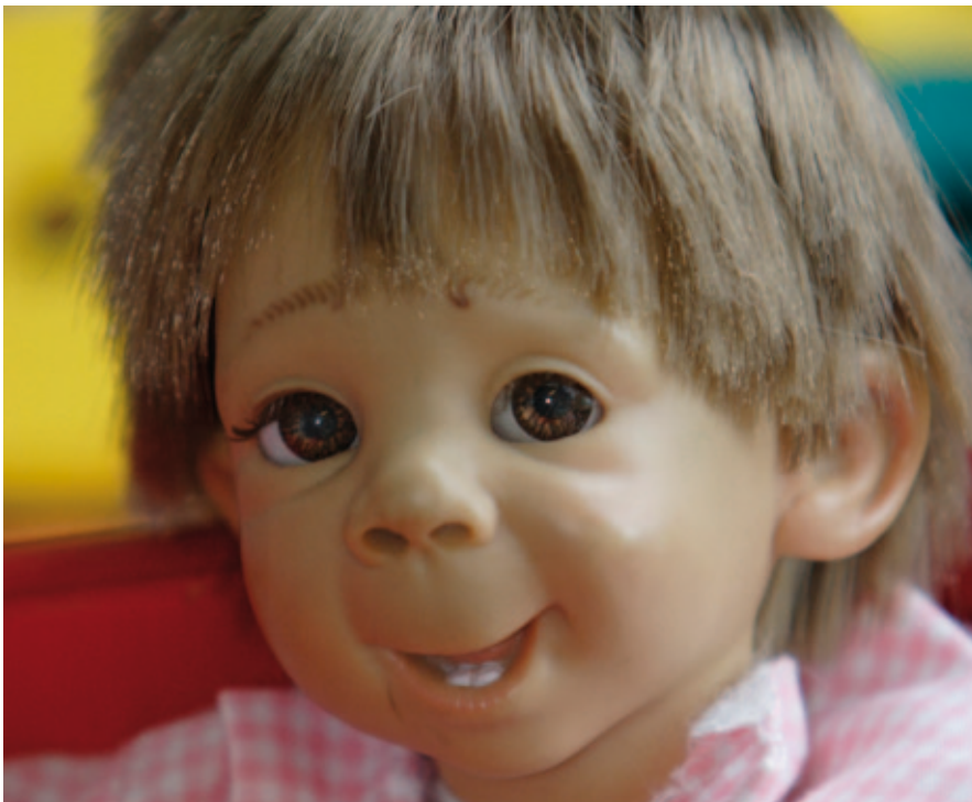
Dukke til undervisningsbrug viser de karakteristiske ansigtstræk ved føtal alkoholsyndrom, bl.a. manglende næse-læbefure, lang øjenafstand, bred flad næseryg, lille opstoppet næse, lille vigende hage og lavt placerede, bagudvendte ører. Lille hovedomfang.

disse ansigtstræk til stede, hos andre kun enkelte. Mindst to af disse træk skal være til stede for, at FAS-diagnosen kan stilles.