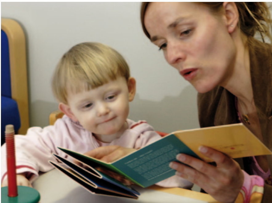
Når kontakten er skabt, undersøges barnets adfærd og udvikling.